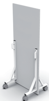
Barriera mobile anti raggi x senza visiva SM2B00