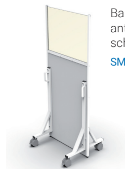
Barriera mobile anti raggi x con schermo 80x60 cm SM2B86